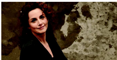
Emmanuelle Haïm direction musicale

Après des études de piano et de clavecin et un début de carrière riche en rencontres artistiques, Emmanuelle Haïm choisit la direction d'orchestre et fonde en 2000 Le Concert d'Astrée. Simultanément, elle est demandée par les scènes internationales les plus prestigieuses. En 2001, elle connaît un succès retentissant au Glyndebourne Touring Opera avec Rodelinda de Haendel. Ses interprétations et son énergie lui valent d'être surnommée par la presse anglaise « The Ms Dynamite of French Baroque ». Elle est ainsi la première femme à diriger au Chicago Lyric Opera ( Giulio Cesare , 2007). Fidèle du Glyndebourne Festival Opera, elle y présente de nombreux ouvrages. Elle dirige régulièrement l'Orchestre Symphonique de Birmingham (CBSO), le Scottish Chamber Orchestra, le Hessischer Rundfunk Orchestra de Francfort, et le Los Angeles Philharmonic (2011, 2015). Depuis 2008, une relation privilégiée avec l'Orchestre Philharmonique de Berlin l'amène à diriger successivement en tant que Chef invitée en 2008, 2011 et 2014. Ses enregistrements pour le label Erato / Warner Classics avec son ensemble Le Concert d'Astrée sont abondamment récompensés. Fidèle représentante du baroque et du savoir-faire musical français, elle est Chevalier de la Légion d'honneur, Officier des Arts et des Lettres et Honorary Member de la Royal Academy of Music. Emmanuelle Haïm et le Concert d'Astrée sont en résidence à l'Opéra de Lille depuis 2004 où ils se produisent plusieurs fois chaque saison.