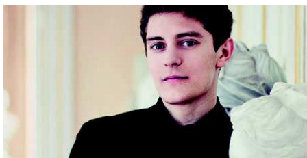
Jakub Józef Orliński (contre-ténor) Unulfo

Le contre-ténor Jakub Józef Orliński naît le 8 décembre 1990 à Varsovie, en Pologne. Il étudie le chant à l'Université de musique Frédéric Chopin, d'où il sort diplômé en 2012. Il intègre par la suite le Young Artists Programme de l'Opéra national de Varsovie.