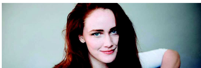
Avery Amereau (mezzo-soprano) Eduige