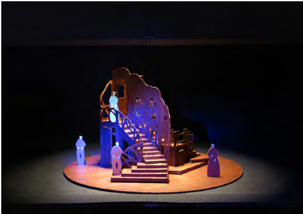
Maquette du décor – ateliers de l'Opéra de Saint-Étienne

Hector Berlioz, Journal des débats , 1845