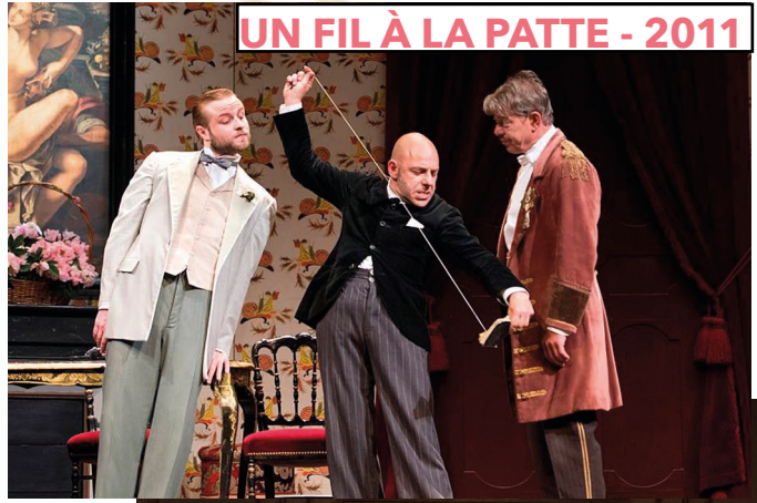
UN FIL À LA PATTE - 2011

Jérôme Deschamps naît à Neuilly-sur-Seine. Deux oncles influents: le premier est acteur, Hubert Deschamps, le second cinéaste, Jacques Tati. Elève au Lycée Louis-le-Grand, il fréquente l'Atelier théâtral et rencontre Patrice Chéreau et Jean-Pierre Vincent, avant d'entrer à L'École de la Rue Blanche puis au Conservatoire National Supérieur d'Art Dramatique. Il entre pour trois ans à la Comédie Française. Antoine Vitez le mettra en scène à plusieurs reprises.