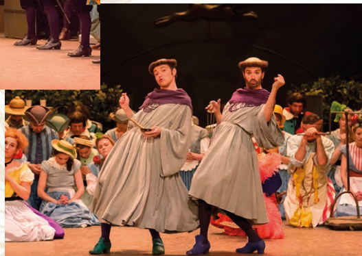
LES MOUSQUETAIRES AU COUVENT - 2015

En 2016, il fonde la Compagnie Jérôme Deschamps, soutenue par le Ministère de la Culture et de la Communication, avec laquelle il produit Bouvard et Pécuchet et Le Bourgeois gentilhomme.