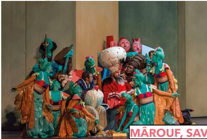
MÂROUF, SAVETIER DU CAIRE - 2013