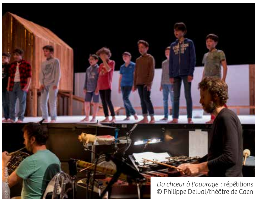
Du chœur à l'ouvrage : répétitions

Les Maîtrisiens suivent chaque semaine des cours de chant collectif, de technique vocale individuelle, de formation et de culture musicales. Selon le principe de la pédagogie de projet, l'apprentissage artistique est valorisé lors de prestations publiques régulières produites par le théâtre de Caen. Varié, le répertoire abordé tout au long du cursus va de la musique médiévale à la