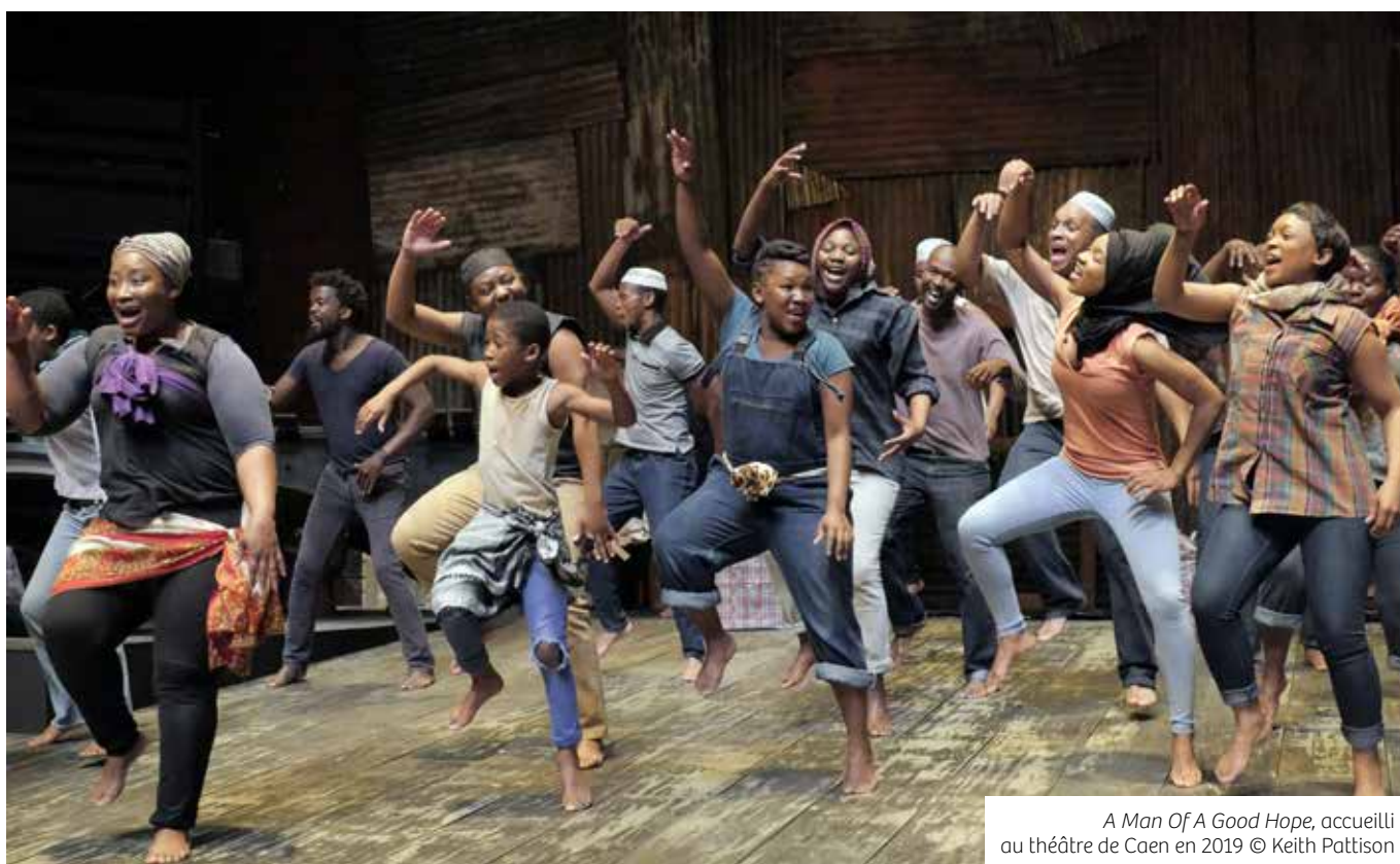
A Man Of A Good Hope , accueilli au théâtre de Caen en 2019

La compagnie sud-africaine Isango Ensemble est basée à Cape Town. Formée en 2000, la compagnie se compose essentiellement d'artistes originaires des townships des alentours. Elle accueille des artistes à toutes les étapes de leur carrière, permettant aux plus expérimentés de diriger et de contribuer à l'accompagnement des jeunes talents. Au sein de la compagnie, se trouvent des interprètes aux compétences variées.