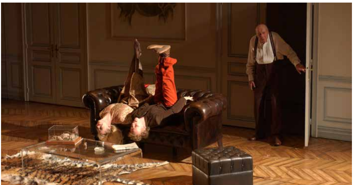
Le Dindon mise en scène Lukas Hemleb, 2002

Florence Thomas Archiviste-documentaliste à la Comédie-Française