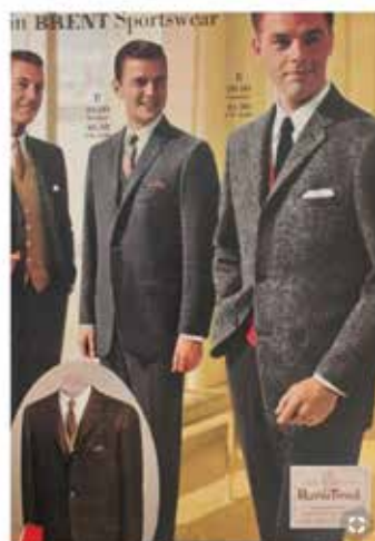
LA PUCE A L'OREILLE – création 2019-20