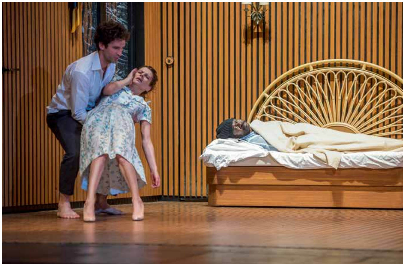
Photographie de répétition