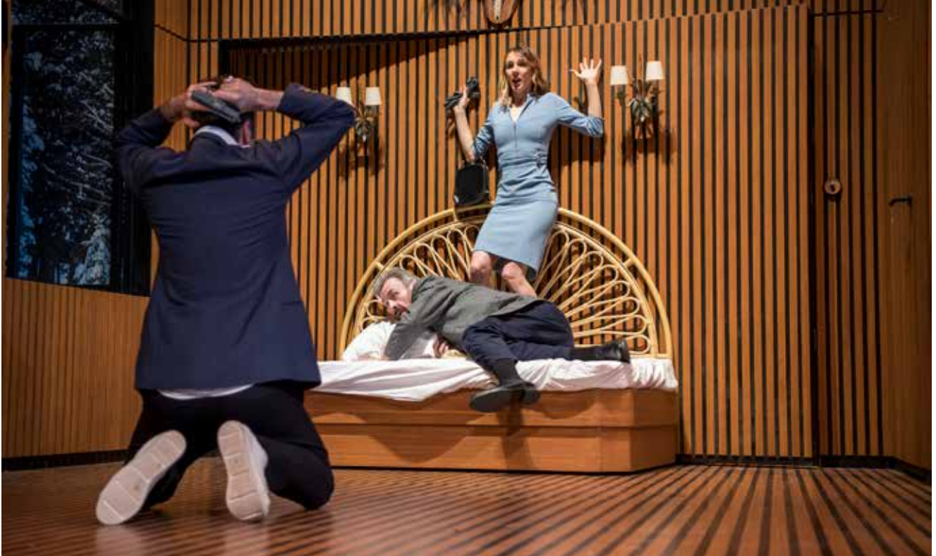
Photographie de répétition