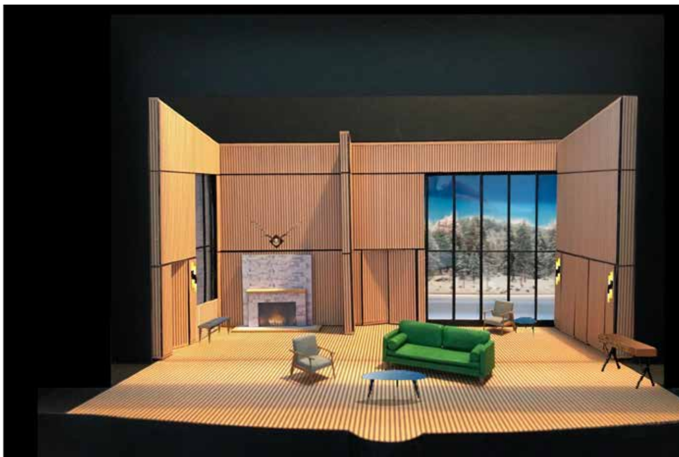
La Puce à l'oreille - Act 1 & 3