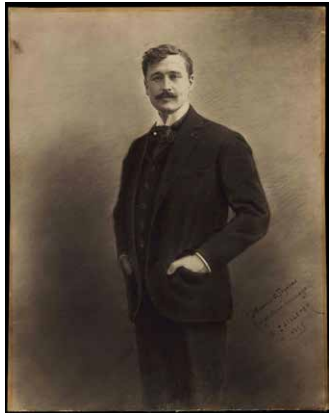
Georges Feydeau / E. Failleter, 1899, fusain ©P. Noack, coll. Comédie-Française.

Peut-être les déboires de la vie conjugale relatés dans les cinq courtes pièces écrites entre 1908 et 1916 et rassemblées sous le titre Du mariage au divorce , doivent-ils leur amertume à la vie personnelle de l'auteur. Les sujets de dispute ne manquent pas : des retours trop tardifs ( Feu la mère de madame , 1908), la difficile éducation des enfants ( On purge bébé , 1910), l'indécence vestimentaire féminine en société ( Mais n'te promène donc pas toute nue , 1911), la venue au monde d'un enfant ( Léonie est en avance , 1911), et l'aigreur d'une épouse ( Hortense a dit :