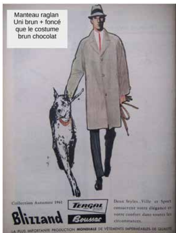
LA PUCE A L'OREILLE – création 2019-20