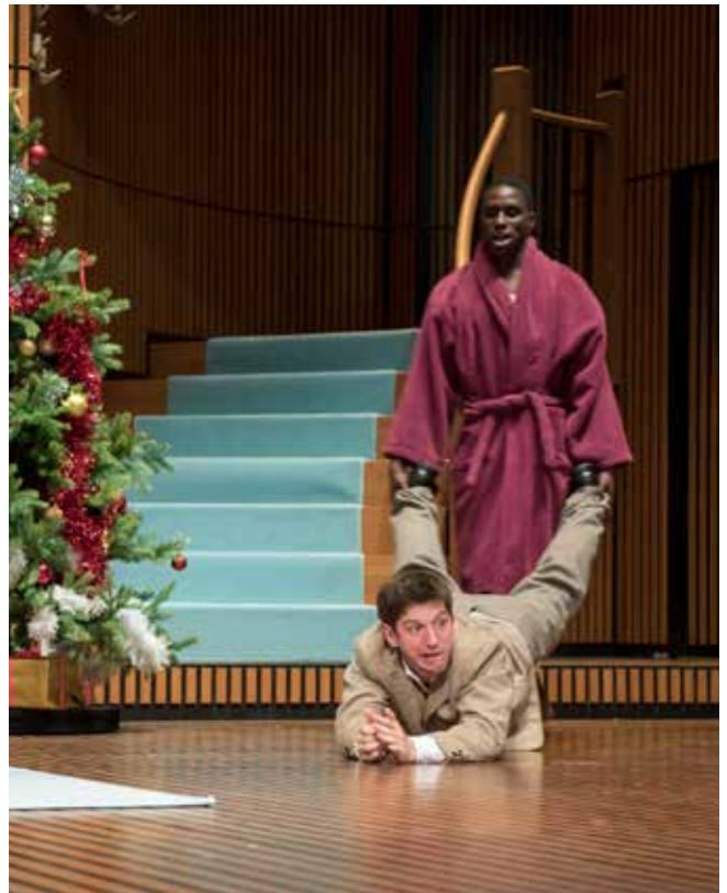
Photographie de répétition