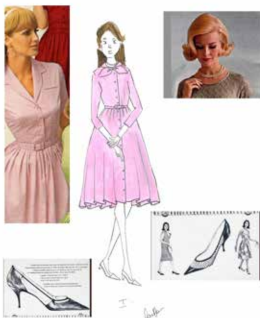
LA PUCE A L'OREILLE – création 2019-20 Mise en Scène Lilo Baur – costumes Agnès Falque