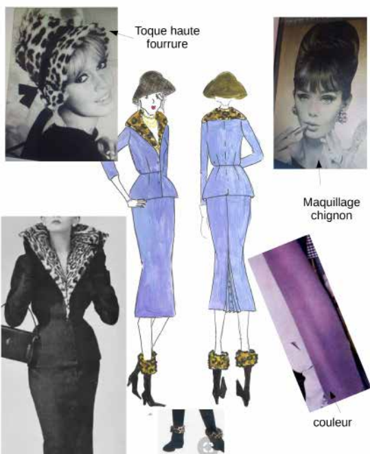
LA PUCE A L'OREILLE – création 2019-20 Mise en Scène Lilo Baur – costumes Agnès Falque