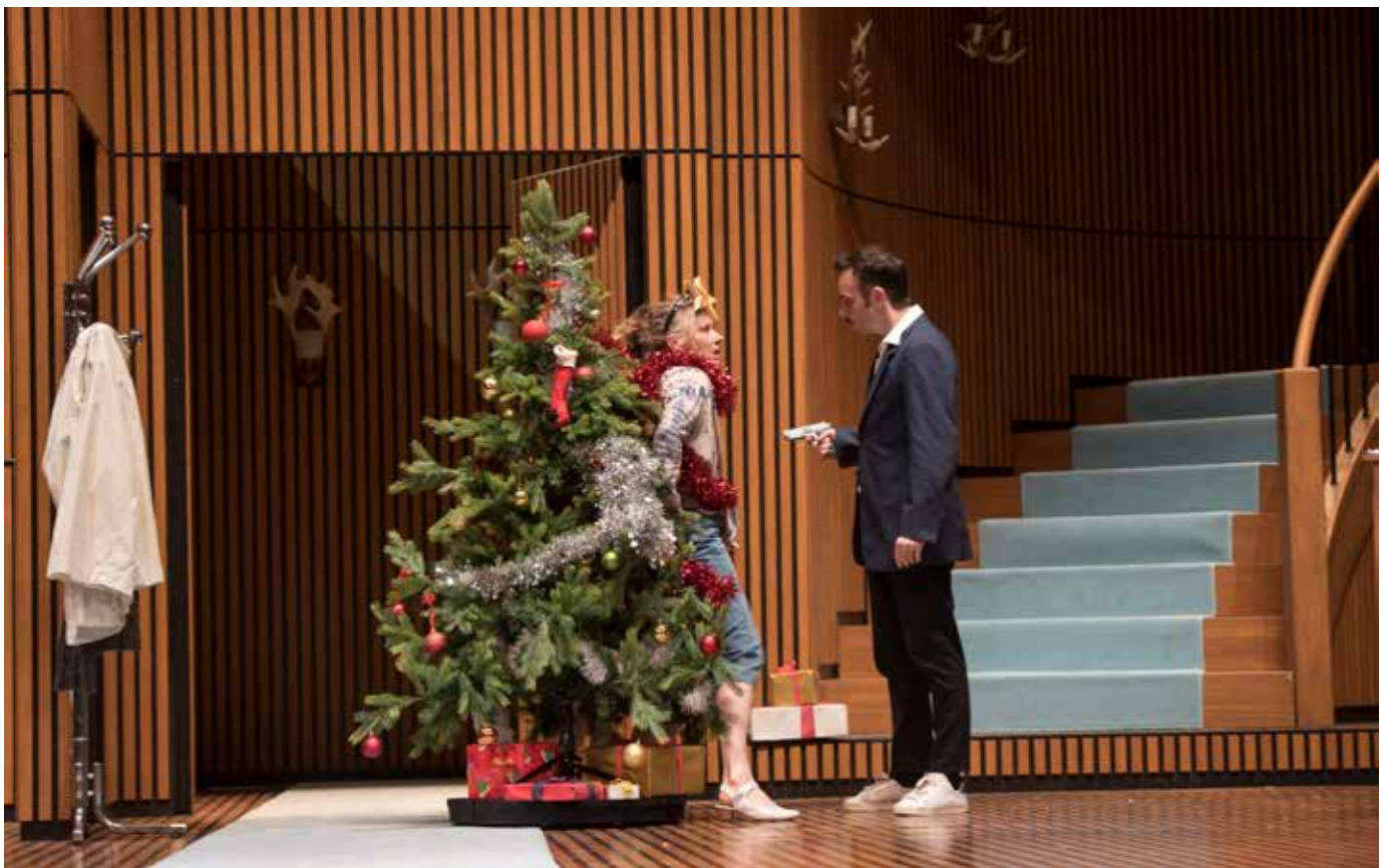
Photographie de répétition