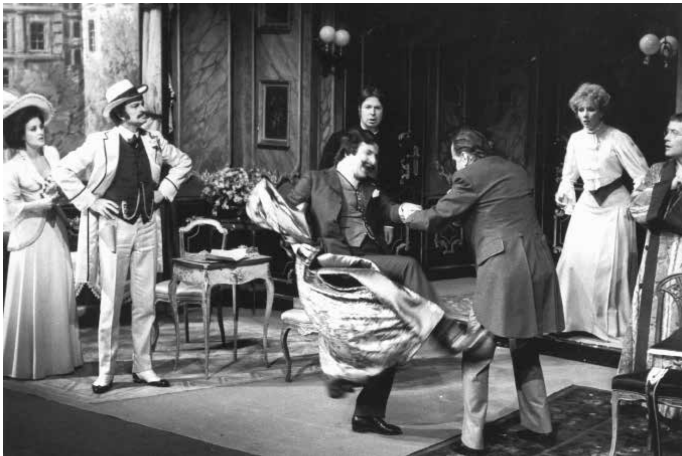
La Puce à l'oreille , mise en scène Jean-Laurent Cochet, 1978.

Avec la reprise du spectacle en 1979, on compte 81 représentations de La Puce à l'oreille Salle Richelieu.