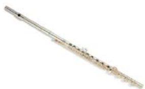
La flûte traversière