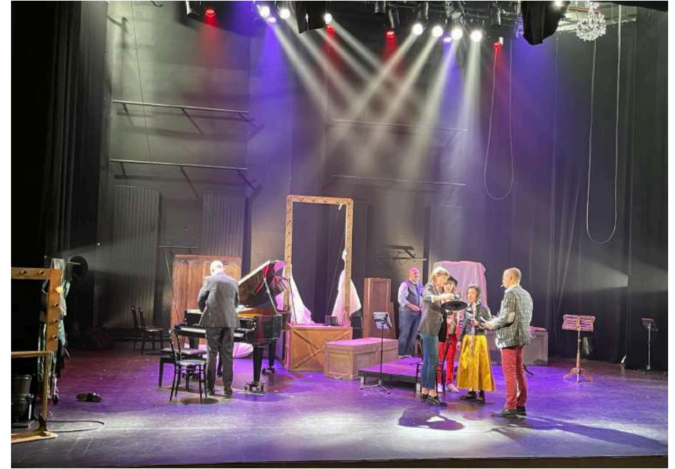
Création lumière au Théâtre d'Auxerre

La musique du spectacle sortira en disque et sur les plate-formes en sep- tembre 2024 chez No- Mad Music.