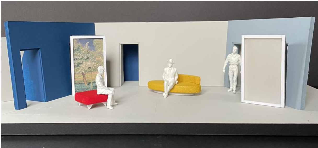
Maquette du décor : Edouard Laug – octobre 23